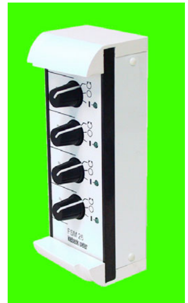
Abb. FSM26 mit Wandaufbau-Set WAS01